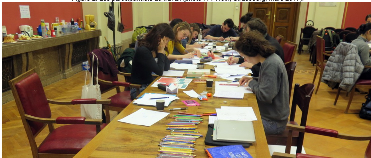
Figure 2. Les participant.e.s au travail (photo : F. Troin, Strasbourg, mars 2017).

L'atelier sera limité quant au nombre de participants (une quinzaine) et se concentrera sur une ou deux consignes simplifiées. Les participant.e.s apporteront s'il en possèdent, crayons, feutres, blocs et autres matériels de dessin, éventuellement un support rigide si nous sortons faire une balade sensible.